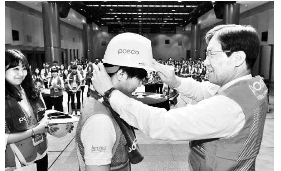
지난해 제10기 비욘드 단원 발대식 모습.