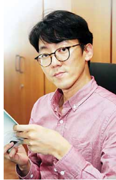
많은 책을 번역하기 힘들지만 관심분야인 인간정신과 심리 등을 다룬 책을 번역해보고 싶다”고 말했다. 독자들에게 더 나은 삶을 사

그가 주로 번역하는 책은 대중들에게 친숙하게 다가갈 수 있는 취미·실용서다. ‘프랑스 자서로 더 사랑스러운 아기웃’, ‘프랑스 야생화 자수’, ‘키즈 텐트 만들기’, ‘아름다운 프랑스 새 자수’ 등이 지난 2015년과 2016년 국내 출판사를 통해 이미 출간됐다. 번역본 가운데 취미·실용서가 많은 이유는 출판 에이전시에서 번역을 의뢰받기 때문이다. 현재 번역하고 있는 책도 수공예 관련 서적이다. 하지만, 그는 “업무로 바쁘기 때문에 분