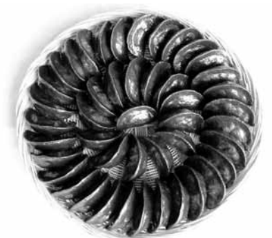
다"고 말했다. 한편 영광 대표 특산물인 영광모시잎송편은 서해안의 갯바람으로 자란 모시잎과 영광산 동부, 쌀로 빚어낸 갈숨, 철, 마그네슘, 칼륨이 풍부한 알칼리성 식품으로, 맛이 좋고 향산화 성분과 식이섬유도 다량 함유돼 있다. /영광=이종윤기자 jlylee@

영광군은 "대표적 특산품인 '영광모시잎송편'이 국립농산물 품질관리원의 승인을 받아 지리적 표시 제104호로 등록됐다"고 28일 밝혔다. 이에 따라 영광군에서 생산되는 쌀, 모시, 동부로 만든 모시잎 송편에는 국가 인증 브랜드를 사용할 수 있게 된다. 특히 지리적표시는 생산된 지역을 표시하는데 그치지 않고, 대한민국을 대표할 수 있는 품질과 명성 및 역사성을 갖춘 지역 특산물에만 부여된다는 점에서, 지역을 넘어 우리나라를 대표하는 명산물로 중점 육성할 수 있게 됐다. 영광군 관계자는 "영광모시잎송편의 지리적표시 등록으로 지역 농산물의 생산과 소비가 동반 성장하고, 영광 떡 산업의 부가가치 향상 및 지역 경제 활성화에도 크게 도움이 될 것으로 기대된