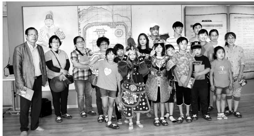
보성군 소재 이순신 리더십 교육관인 '방진관'을 찾은 방문객들이 이순신 장군복 등을 입고 기념촬영을 하고 있다.

지난 3월 명랑문화재단 임원 18명이 방문한 데 이어, 5월에는 인천 동구 교육 열차 방문단 305명이 방진관을 찾아 이순신과 보성의 인연을 되새기는 시간을 가졌다. 또 지난 3일에는 벌교 공공도서관에서