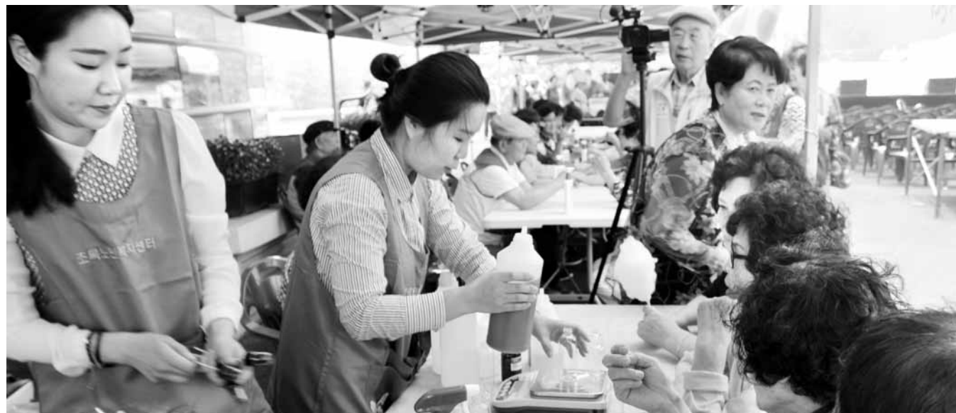
8년간 어르신 건강 돌보기 광주복지재단(대표이사 장현) 빛고을노인건강타운은 개원 8주년을 맞아 8일 오전 건강타운 야외광장에서 회원 1000여명과 함께 기념식을 개최했다. 부대행사로 열린 천연화장품만들기 행사 모습.