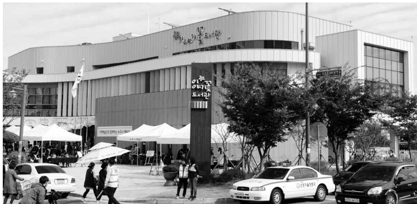
광주시 광산구 이야기꽃도서관은 ‘문제부 특화도서관 육성 시범 사업’에 선정돼 그림책 아카이브 자료관을 구축한다. 도서관 전경.

이야기꽃도서관이 선정과정에서 높은 평가를 받은 것은 도서관이 단순 아카이브