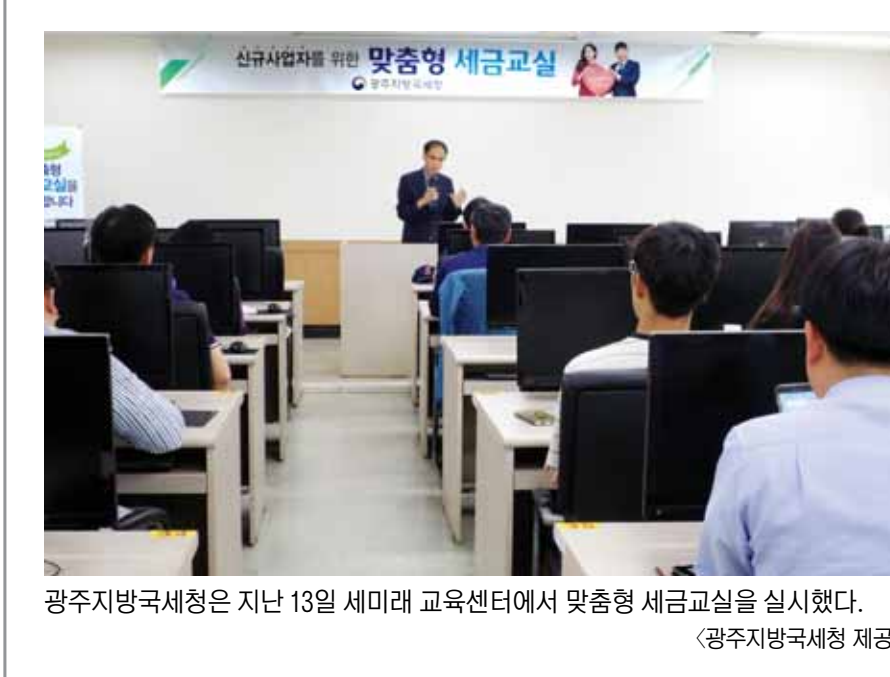
광주지방국세청은 지난 13일 세미나 교육센터에서 맞춤형 세금교실을 실시했다.