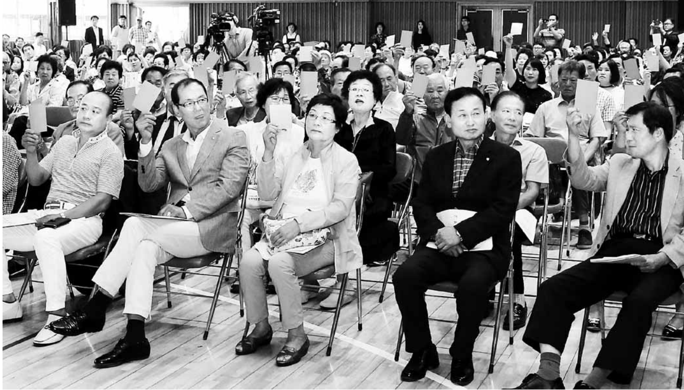
“제 의견은요” 지난 14일 광주 동구청소년수련관에서 열린 '학운동 마을의제 토의'에서 참석자들이 '동적골 산책로 페타이어 매트 설치 안건'에 대해 찬반 투표를 진행하고 있다.

주민 스스로 마을 현안문제를 토의해 개선점을 찾고 해결해가는 '마을의제 토의'가 눈길을 끌고 있다. 광주시 동구는 김성한 청장장이 참석하는 '주민과의 대화'에서 주민들이 마을 최대 현안을 의제로 선정, 토론을 통해 해결하는 '마을의제 토의'를 열고 있다. 지산1동 주민들은 지난 7일 주민과의 대화에서 '조선대 후문 장미의거리 쾌적한 환경 조성'을 마을의제로 내놨다. '하루 1만명 이상 오가는 조선대 후문 거리가 쓰레기로 넘쳐나는데 어떻게 해결할 것인가'가 주제였다. 주민들은 "구정에만 맡기에는 한계가 있다"며 "자율청소단을 구성해 매일 1~2차례 쓰레기를 직접 수거하자"고 결정했다. 또 분리수거함 설치가 필요하다는 데도 의견을 모았다. 이날 토의에 참석한 지산1동 주민들은 "주민 간 이해관계 때문에 갈등과 다툼이 발생하는데 마을의제 토의가 마을문제 해