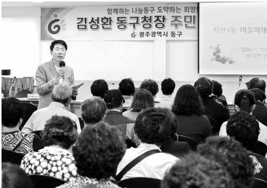
광주시 동구 지산1동 마을의제 토의.

동구, 산책로 정비·대학가 쓰레기 등 스스로 해결 북구 '마을총회' 장터·공연 열며 축제장으로 변신