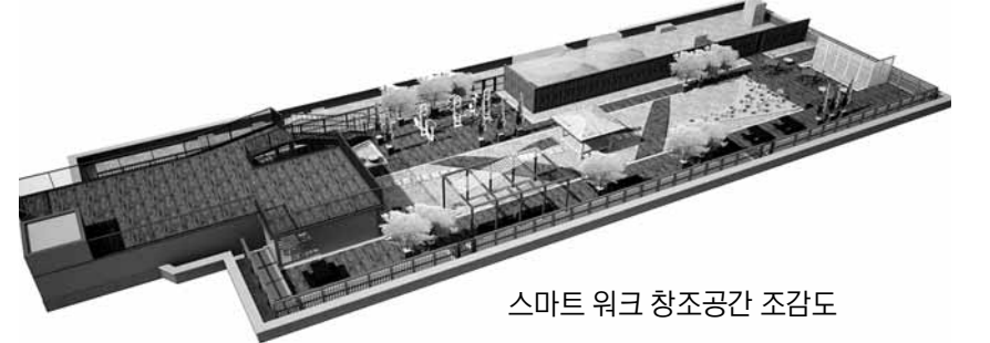
스마트 워크 창조공간 조감도

광주 북구청사 옥상이 힐링복지공간으로 탈바꿈한다. 직원들의 정서적 안정과 힐링·휴식 공간을 제공, 즐겁게 일할 수 있는 직장분위기를 조성하기 위해서다. 광주시 북구는 직원들의 업무 생산성을 향상시키기 위한 '스마트 워크 창조공간 조성사업'을 본격 추진한다고 20일 밝혔다.