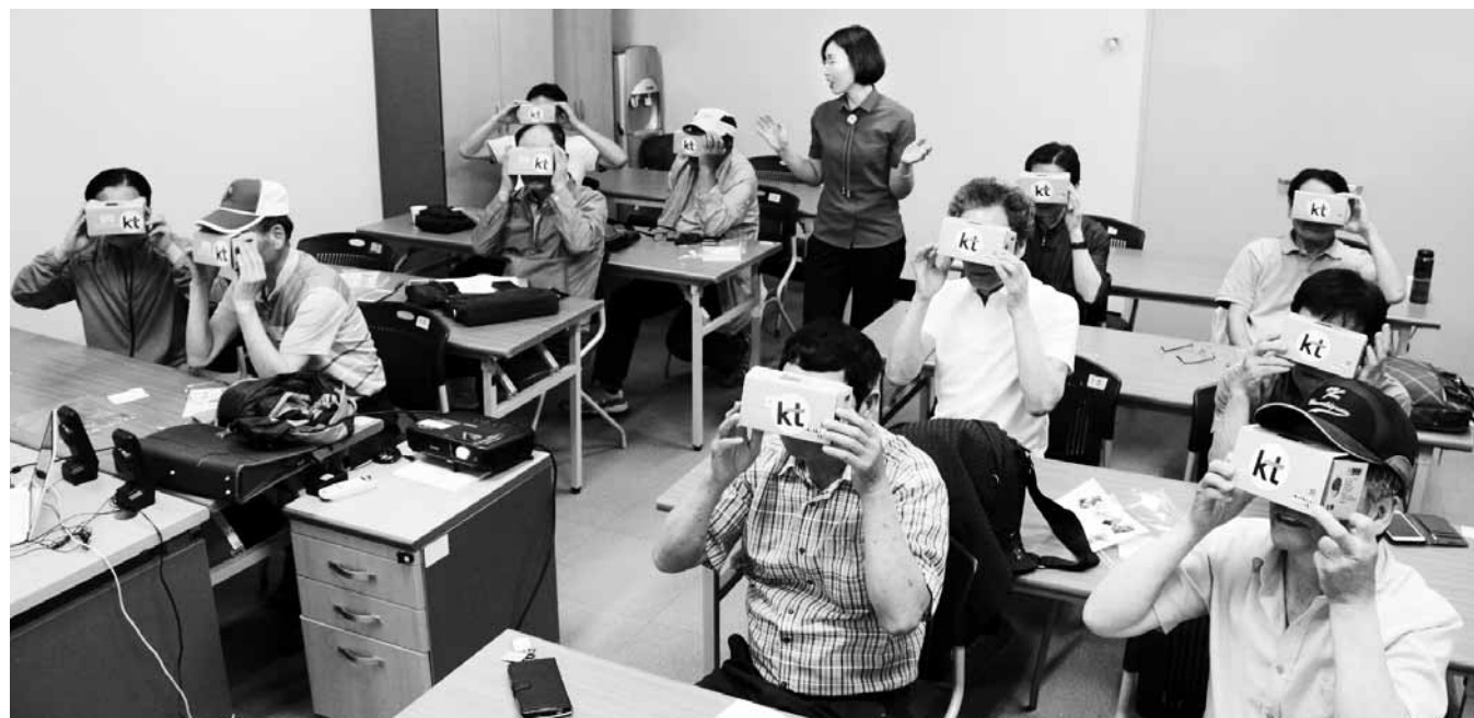
빛고을노인건강타운이 진행한 ‘뇌활력’ 프로젝트 참가자들이 VR 단말기 만들기 체험을 하고 있다.

광주복지재단은 빛고을노인건강타운 내 주차장 2곳에 장애인 등 교통약자 이동편의를 위해 특별교통수단(Special Transport Service) 승강장인 ‘새빛콜 등대’를 설치했다고 20일 밝혔다. 특별교통수단이란 휠체어 탑승설비를 장착한 차량으로, 교통약자를 위해 출발지에서 도착지까지 안전하고 편안하게 이동할 수 있도록 대중교통체계를 보완하는 수단이다. ‘새빛콜 등대’의 위치는 휠체어 장애인과 신체기능이 약한 교통약자들의 동선을 고려해 엘리베이터와 연결이 가능한 빛고을노인건강타운내 체육관 앞과 후생관 앞 주차장이다. 그동안 빛고을노인건강타운에는 특별교통수단 이용자를 위한 승강장이 없어 교통약자이동지원센터 차량 운전자와 차량 이용시간 소통에 불편함이 있었지만 이번 승강장 설치를 통해 안전하고 편리한 승·하차를 할 수 있을 것으로 기대된다. /최권일기자 cki@kwangju.co.kr