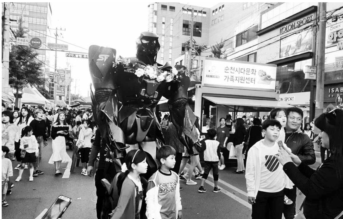
지난해 열린 광주프린지페스티벌에서 펼쳐진 '자이언트 로봇' 거리 행진.