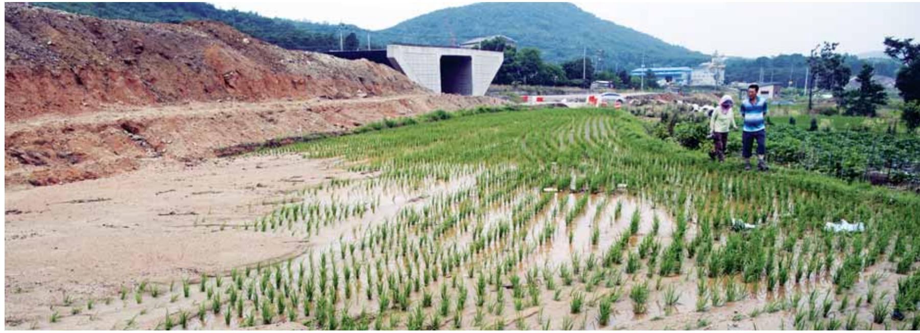
토사 덮친 논 27일 광주시 광산구 삼거동 칠성마을 인근의 논과 밭들이 전날 내린 국지성 호우로 인해 흘러내린 토사로 뒤덮여있다. 마을 주민들은 인근 빗고을산단 진입로 공사현장의 배수구가 좁아 넘쳐 오른 빗물이 논밭을 덮었다고 주장하고 있다.