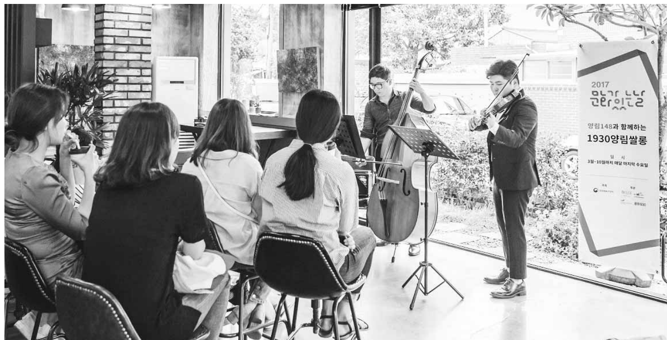
매달 마지막 수요일에 다양한 문화 혜택을 제공해온 '문화가 있는 날'을 7월부터 '매달 마지막 주간'으로 확대해 운영한다. 광주 양림동을 배경으로 펼쳐지는 '1930 양림살롱'의 쌀롱콘서트 모습.

▲쌀 등급표시제 개선=지금까지는 쌀 검사를 하지 않은 경우 '미검사'를 표시할 수 있었으나, 미검사 비율이 높아 제도 취지가 훼손되고 소비자 알 권리가 침해된다는 지적에 따라 10월부터는