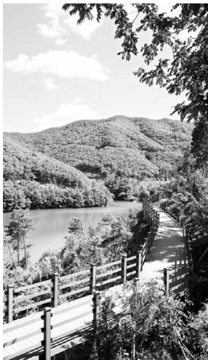
제암산 자연휴양림 전경. 휠체어를 타고 도 산책이 가능한 5.8km 무(無)장애 트레킹 로드 '더닐길'.

제암산 자연휴양림은 '임금 제'(帝)자 모양의 기암괴석으로 유명한 제암산(해발 807m) 자락에 자리하고 있다. 지난 1996년 개장 이후 아열대, 물놀이장 등 매년 편의 시설을 확충해 왔으며 4계절 관광지로 각광을 받고 있다./보성=김용백기자 kyb@