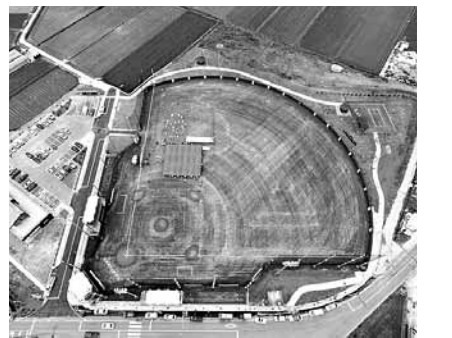
가 전국 최고의 전지훈련장으로 거듭나면서 주변 관광지와 연계, '고흥관광 2천만 시대'를 완성시키는 데 힘을 쏟을 것"이라고 말했다. /고흥=주각종기자 gjuu@

도화베이스볼파크의 경우 KBO공인 정식 규격(센터 122m, 좌우 100m)에 맞춰진 시설로 본부석, 덕아웃, 조명시설 등을 갖춰 각종 야구대회와 전지훈련팀 유치에 도움이 될 것으로 기대되고 있다. 고흥군 관계자는 "도화 베이스볼파크