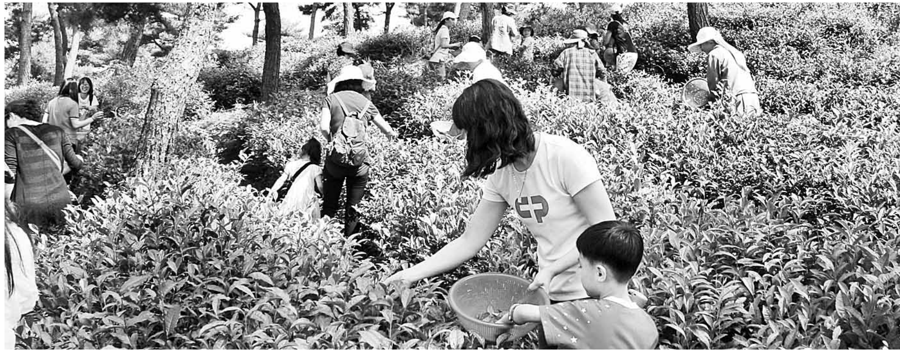
녹차밭에서 신나는 하루 정읍지역 다원을 찾는 지역민들의 발길이 줄을 잇고 있다. 4일 정읍기술센터에 따르면 정읍 황토현다원과 현암다원, 태산명차 등 지역 다원이 운영하는 녹차 만들기 체험 프로그램에는 시민들의 문의와 참여가 이어지고 있다.