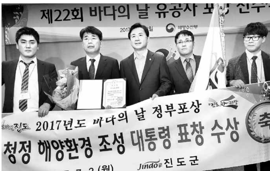
증가를 유도해 어업인의 소득증대에도 이바지했다. 또 세월호 참사 당시 구조활동부터 시작

세월호 침몰 참사 당시 앞장 서 구조활동을 펼치고 희생자 가족 등에 대한 지원을 아끼지 않았던 진도군이 대통령 기관 표창을 받았다. 진도군은 최근 해양수산 부문 발전에 기여한 공로로 대통령 기관 표창(사진)을 받았다고 5일 밝혔다. 군은 지난 3일 해양수산부에서 열린 2017년 바다의 날 유공자 포상 전수식에서 바다환경 보호와 수산자원 증강 등에 기여한 공로를 인정받았다. 군은 최근 3년간 해양쓰레기 3000여톤을 수거·처리했다. 연안 해역에 최근 3년 동안 전복, 꽃게, 해삼 등 모두 35만여 마리의 수산종류를 방류해 어장환경 복원과 함께 수산자원을