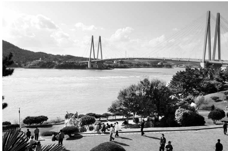
진도군이 최근 '녹진관광지 조성계획'을 변경하면서 해상케이블카를 타고 명량대첩 현장인 울돌목과 해남 우수영을 둘러볼 수 있는 사업이 본격 추진될 전망이다. 곤돌라와 체어리프트가 멈추는 진도타워(왼쪽)와 울돌목 전경.