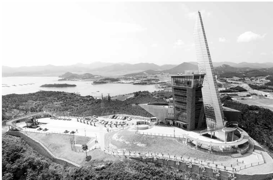
진도군이 최근 '녹진관광지 조성계획'을 변경하면서 해상케이블카를 타고 명량대첩 현장인 울돌목과 해남 우수영을 둘러볼 수 있는 사업이 본격 추진될 전망이다. 곤돌라와 체어리프트가 멈추는 진도타워(왼쪽)와 울돌목 전경.