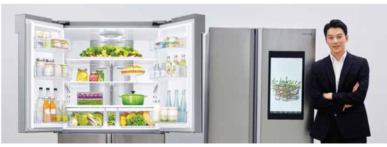
삼성전자 모델이 2017년 '패밀리허브' 기능을 탑재한 4문형 T9000(왼쪽)과 양문형 F9000 신제품을 소개하고 있다.

삼성전자는 소비자 선호도가 높은 4문형 'T9000'과 양문형 'F9000'에 2017년형 '패밀리허브' 기능을 탑재한 신제품을 출시한다고 12일 밝혔다. 삼성전자는 2013년 출시 이후 소비자에게 인기가 높은 '지펠 푸드스케이프' 모델 F9000에 패밀리허브 기능을 처음 적용했다. F9000에 탑재한 '푸드스케이프'는 자주 꺼내는 음료, 간식 등은 바깥쪽 '스케이프'에 사용 빈도가 낮고 부피가 큰 식재료는 안쪽 '인케이스'에 보관하는 차별화된 수납공간을 제공한다. 패밀리허브 적용을 확대하면서 2017년형 패밀리허브 냉장고 라인업은 셰프 컬렉션 2종, T9000 3종, F9000 1종으로 총 6종이 됐다. 2017년형 패밀리허브는 클라우드 기반 음성인식으로 애플리케이션을 제어하는 스마트 냉장고다. 올해 초 열린 'CES