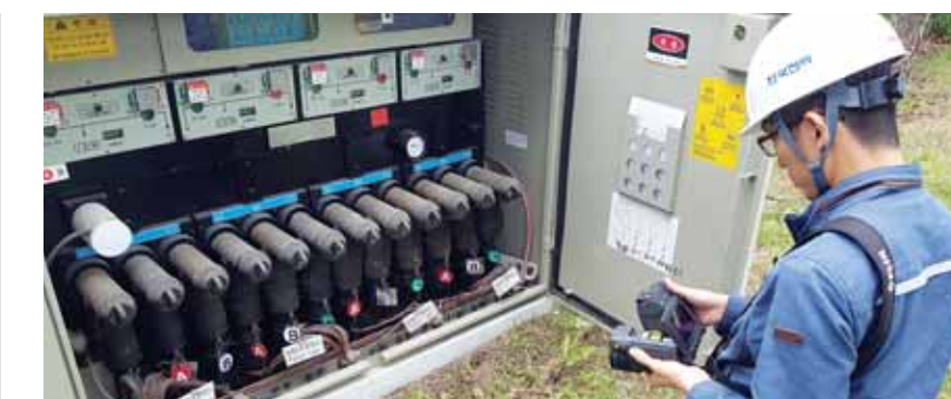
한전 직원이 지상개폐기를 점검하고 있다. <한전 광주전남지역본부 제공>