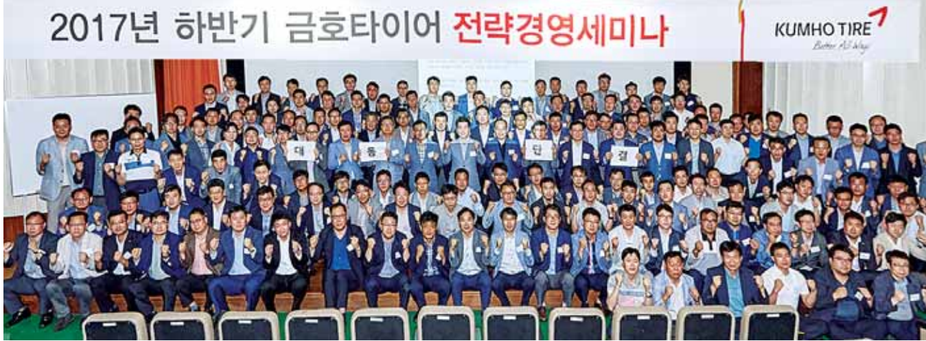
지난 15일 광주시 광산구 금호타이어 광주공장에서 전략경영세미나를 마친 임원과 부서장들이 판매 증대와 신제품 개발 등 자구안을 마련, 향후 2년 내 영업이익률 10%를 달성하겠다고 결의하고 있다.