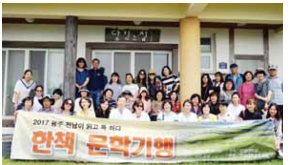
2017 광주·전남이 읽고 특하다 한책 문학기행.

‘광주-전남이 읽고 특하다(이하 광주·전남 특)’ 사업을 추진하고 있는 전남대가 전남 장흥으로 ‘한책 문학기행’ 행사를 다녀왔다.