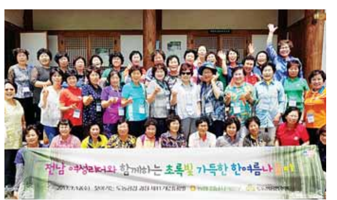
농협중앙회 도농협동연수원과 농협전남지역본부는 12일 담양 무월마을에서 여성소비자 리더 50여명이 참석한 가운데 ‘찾아가는 도농공감’ 연수과정을 실시했다.