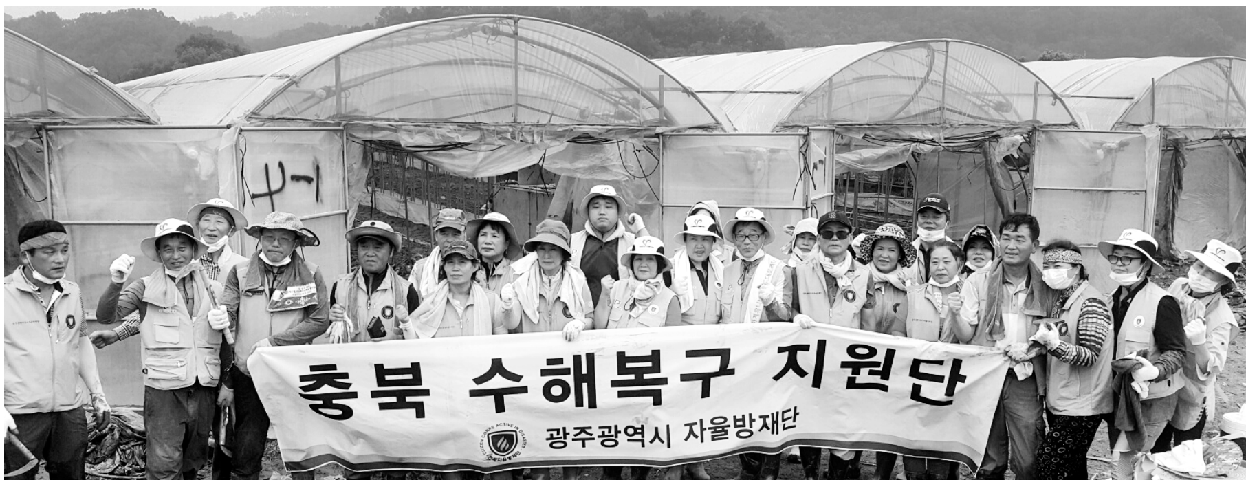
광주 시민들, 충북도민 상처 위로