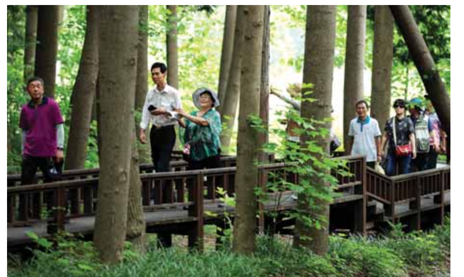
초당림 힐링 산책