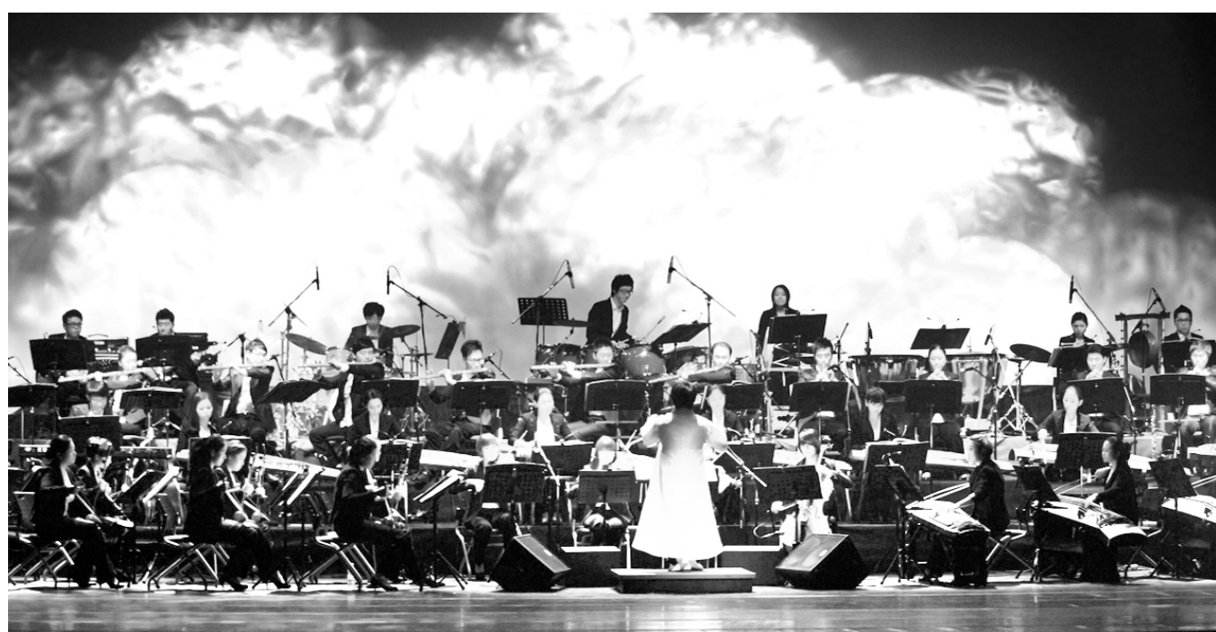
여수시립국악단의 공연 모습.

이들은 군산시간여행축제 기간 전 문가의 도움으로 본인이 소장한 가구를 무료로 직접 리폼할 수 있는 기회를 얻게 된다. 대상품목은 가구·소품 등으로 4시간 이내에 작업 완료 가능하고 재도색이 원활한 원목 재질의 소형가구다. /군산=박금석기자 nogusu@