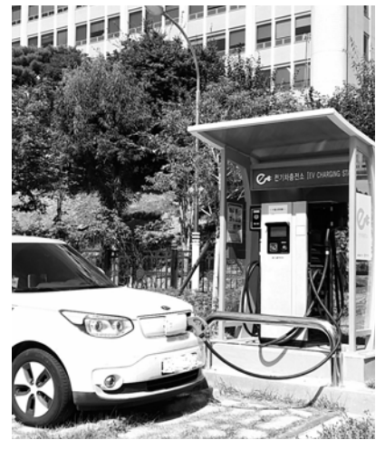
순천시 환경보호과에서 접수하고, 순천시 환경보호과(061-749-5768)로 문의하면 된다.

충전요금도 그린카드로 결제하면 50% 할인 혜택을 받게 된다. 전기차 신청은 제조사별 판매 대리점에서 접수하고, 순천시 환경보호과(061-749-5768)로 문의하면 된다.