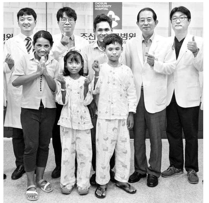
캄보디아에서 조선대학교 병원을 찾은 프응준다양과 비락군이 치료를 마친 뒤 의료진과 기념촬영을 하고 있다.