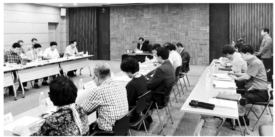
영광군은 최근 물무산 행복숲 실시설계 최종보고회를 갖고 행복숲 조성 계획을 논의했다.

실시설계용역 최종보고회 9.1km 둘레길 3.3km 황톳길 유아숲체험원·명상원도 62억원 들여 12월까지 완료