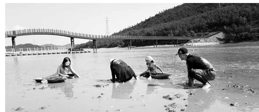
임자면 진리마을 갯벌 체험장.

/김지을기자 dok2000@kwangju.co.kr /영광=이종윤기자 jlylee@