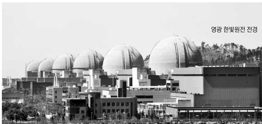
영광 한빛원전 전경