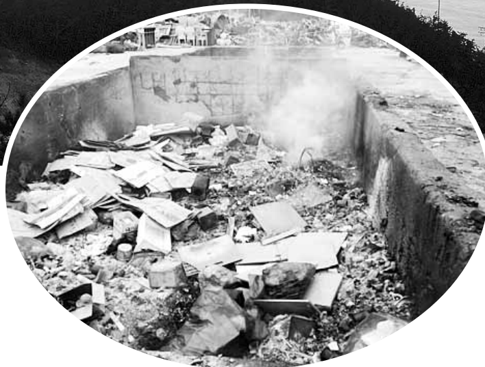
선유도가 육지와 잇는 연결도로의 내년 개통을 앞두고 불법행위로 몸살을 앓고 있다. 선유도 내 쓰레기 불법 소각장.