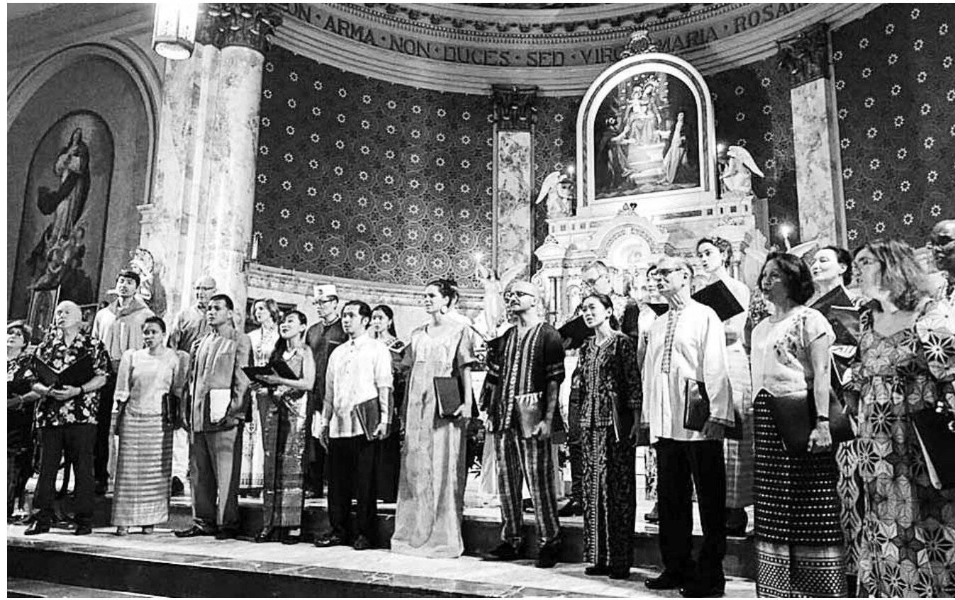
오는 31일 조선대 해오름극장 무대에서는 유엔합창단. 1947년 창단한 유엔합창단은 이번에 처음으로 한국을 방문한다.

그밖에 광주KBS어린이합창단, 광주예술고등학교 크리산데로, 조선대학교 사범대학 음악교육과 콘서트 콰이어&조선대