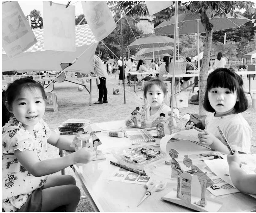
아트피크닉 체험 프로그램에 참여한 어린이들.