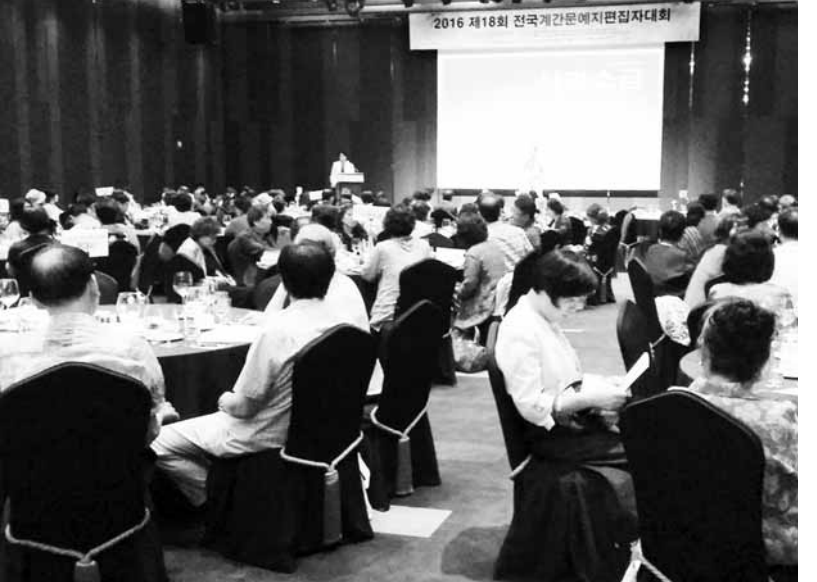
'제19회 전국 계간 문예지 편집자대회'가 19일 광주시 동구 KT빌딩 4층 연회장에서 열린다. 사진은 지난해 수원에서 열린 제18회 모습.

무료 관람. 문의 070-8844-6686. /김미은기자 mekim@kwangju.co.kr