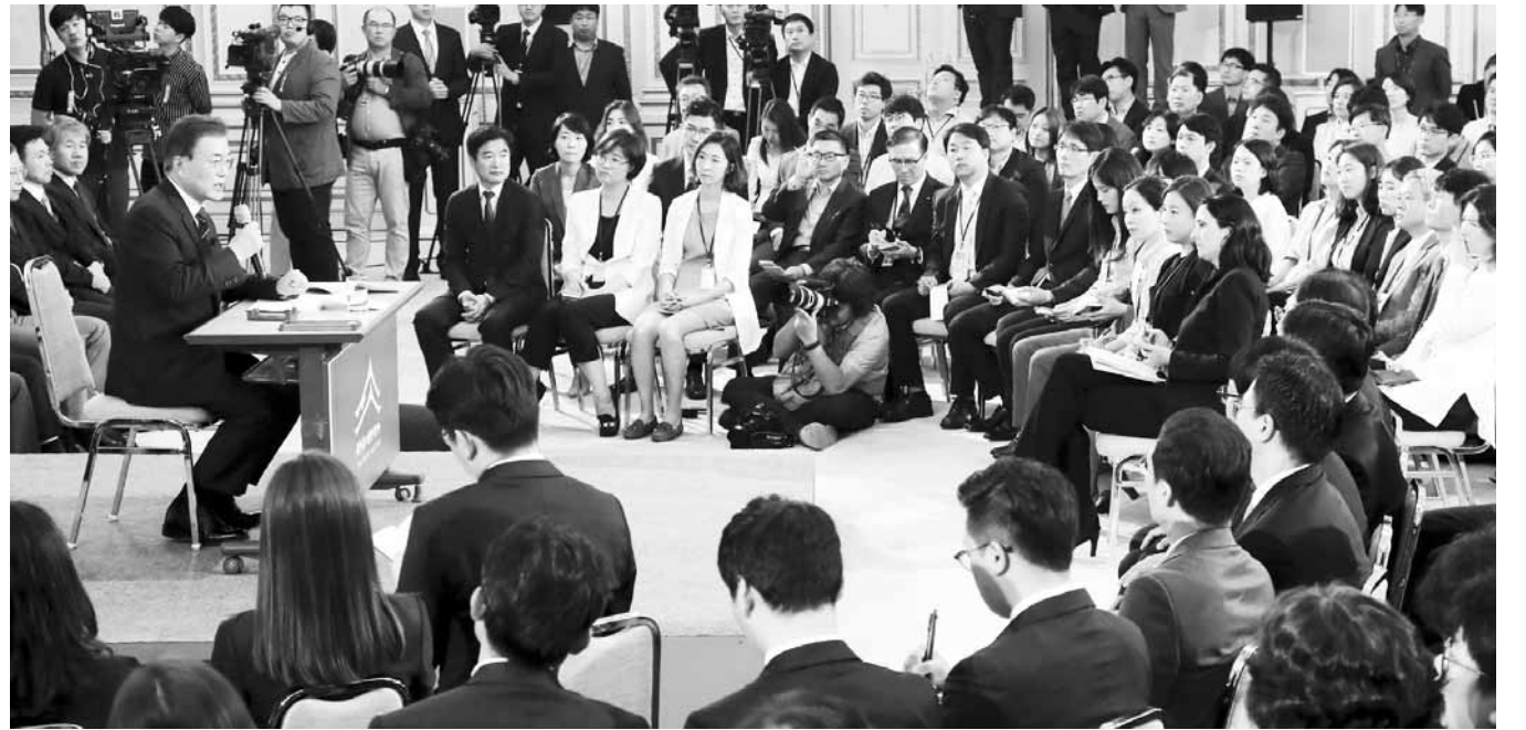
문재인 대통령이 17일 오전 취임 100일을 맞아 서울 청와대 영빈관에서 출입기자들과 취임 후 첫 기자회견을 하고 있다.

문 대통령 취임 첫 기자회견 한반도 전쟁은 다시 없을 것 북 대화 여건 갖춰지면 특사 한·미 FTA 당당한 협상 내년 지방선거 때 개헌 재확인 적폐청산은 불공정 청산 의미