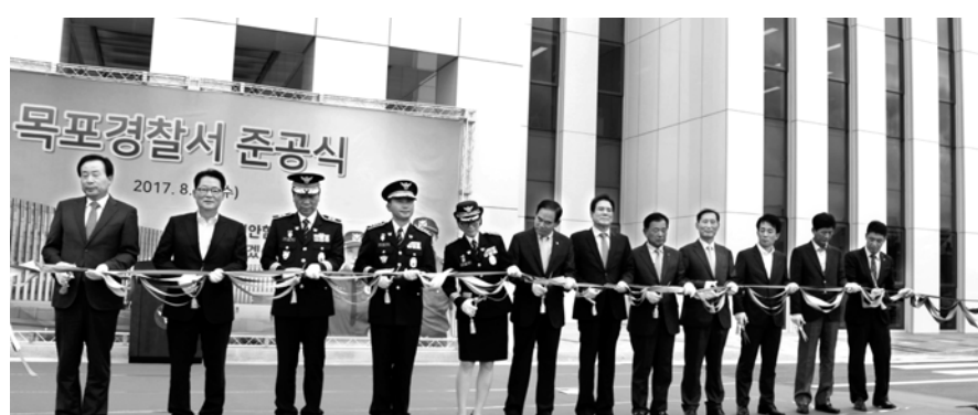
목포경찰 차공 2년만에 동명로 신청사 준공