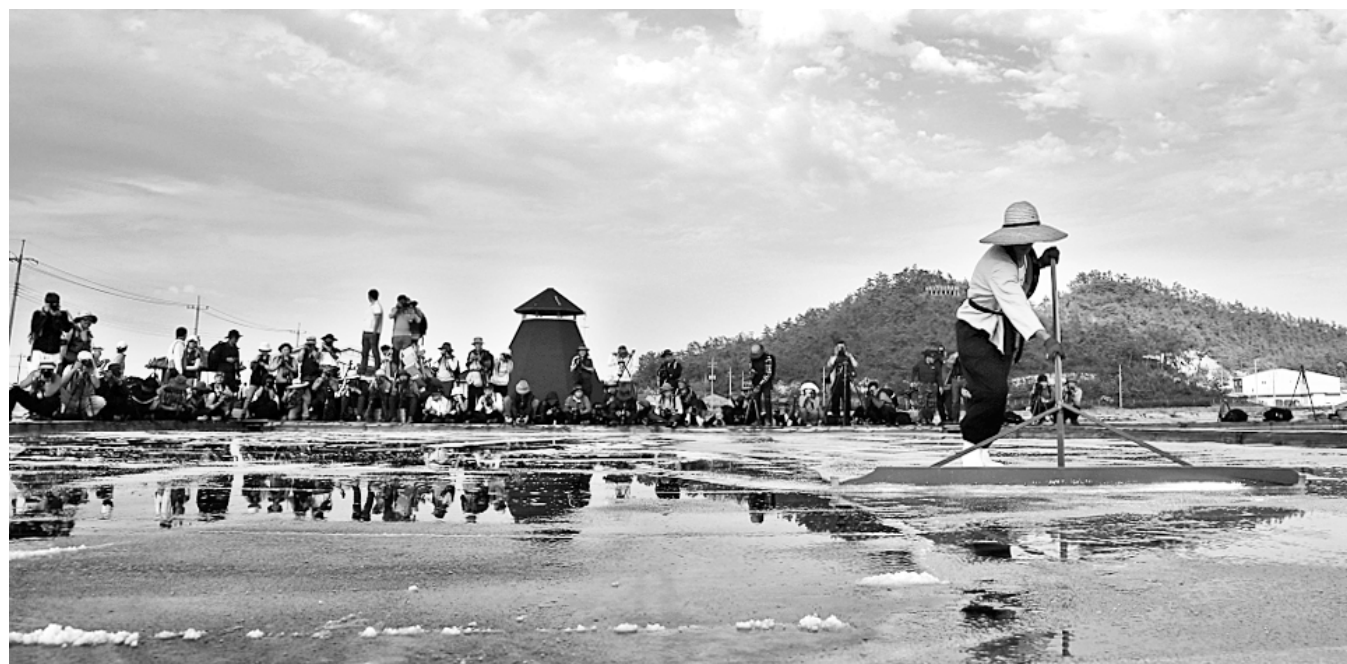
천일염 산업이 위기를 맞고 있는 상황에서 전남 천일염의 우수성을 알릴 소금박람회가 열린다. 신안 염전 전경.

전시장도 단순한 형태의 전시에서 벗어나 천일염의 역사를 비롯, 식품, 미용·화장품 등 일상에서 활용되는 여러가지 형