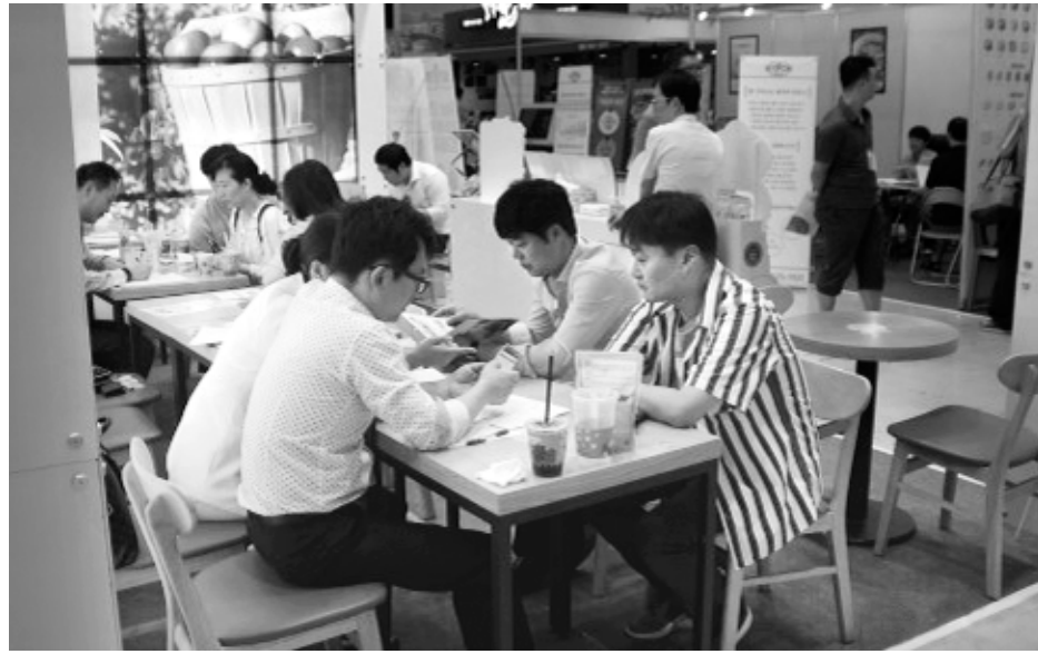
지난해 광주에서 열린 프랜차이즈 창업박람회에서 관람객들이 부스를 찾아 전문가와 창업 상담을 하고 있다. <광주일보 자료사진>

행되는 박람회 현장을 찾았다면 여유를 갖고 즐겨라. 먼저 박람회장을 한 바퀴 가볍게 둘러보면서 최신 트렌드를 익히는 것이 좋다. 관심 있는 브랜드 부스 위치도 파악하고, 생각하지 못했던 새로운 아이템은 있는지 찾아보길 바란다.