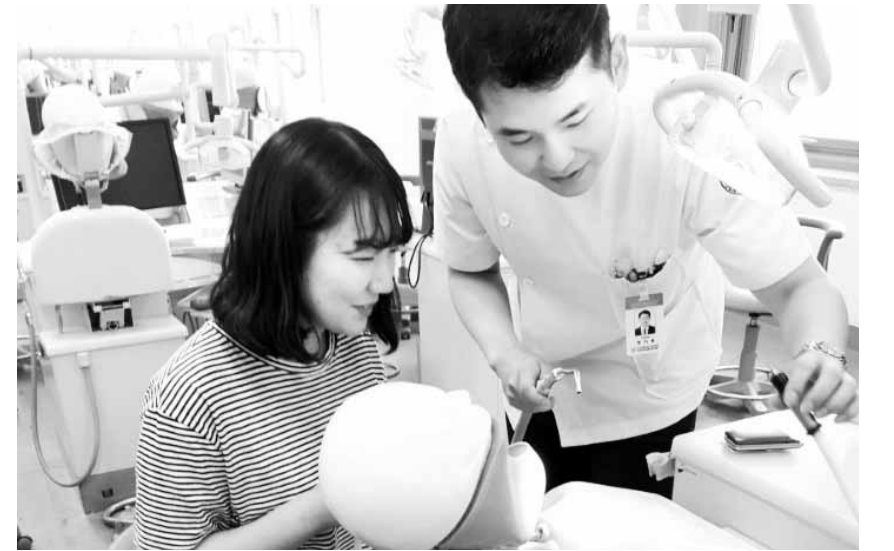
조선대가 지난 26일 진행한 '교수와 함께하는 미래전공설계' 행사에서 한 고등학생이 치의예과에서 실습하고 있다.