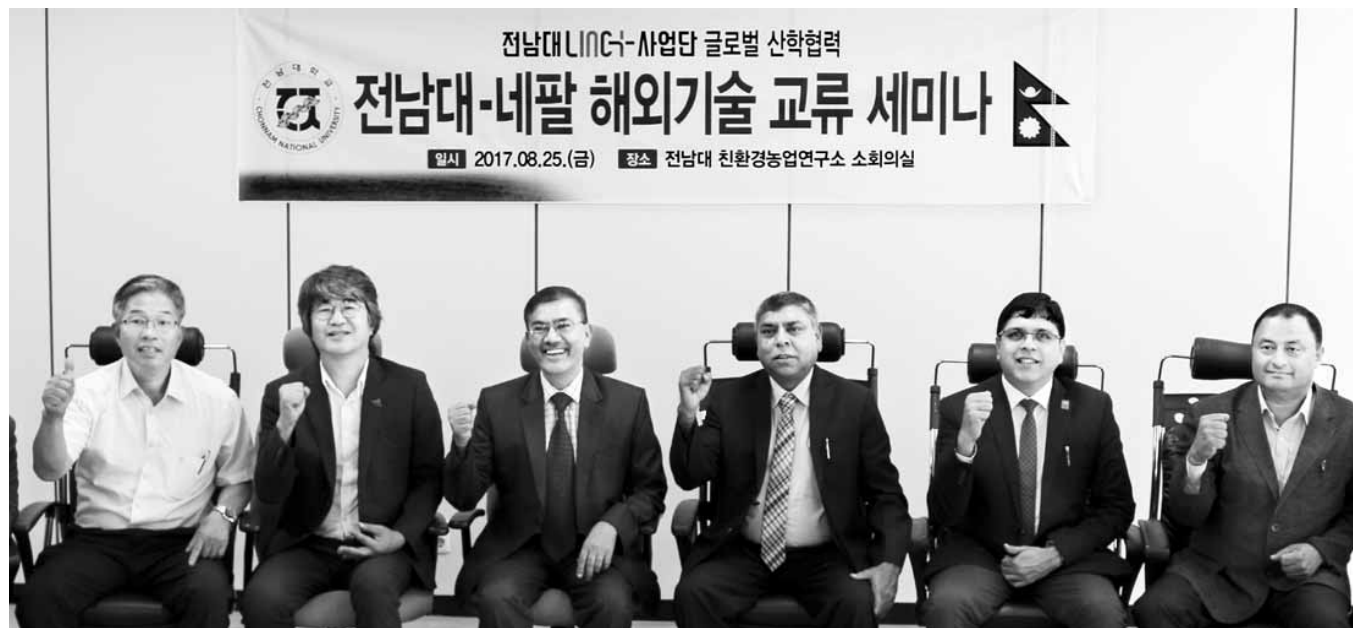
전남대 친환경농업연구소를 방문한 네팔기업인협회 회장단이 세미나 후 기술 교류 강화를 다짐하고 있다.

이번 수출 성과는 전남대학교의 기술 경쟁력과 가족회사의 제품 생산능력이 해외 시장에서도 인정받았음을 보여주는 것으