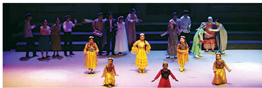
2일 오후 8시 ACC 극장1 야외무대에서 퍼포먼스 공연인 '나는 고려인이다'가 펼쳐진다. <고려인마을 제공>

퍼포먼스 공연인 '나는 고려인이다'는 오후 8시 ACC 극장 1 야외무대에서 열린다.