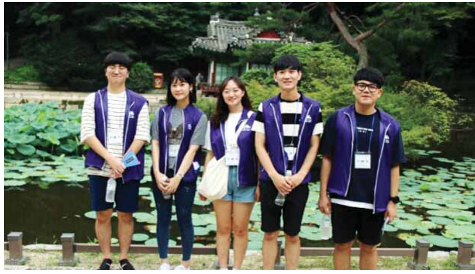
5·18 민주화 운동을 알리기 위해 ‘오월에’를 결성한 한남대학교 역사교육과 학생들.

이들의 교육 프로젝트는 일명 ‘기록물(기록물을 기억하고 기록하자)’. 수업은 모두 2차시로 구성돼 있다. 1차 시에는 ‘5·18 광주민주화 운동’과 ‘5·18 광주 민주화 운동 인권 기록물’에 관련된 영상을 시청하고, 2차 시에는 ‘기록물을 활용한 퍼즐을 맞추기’를 한다.