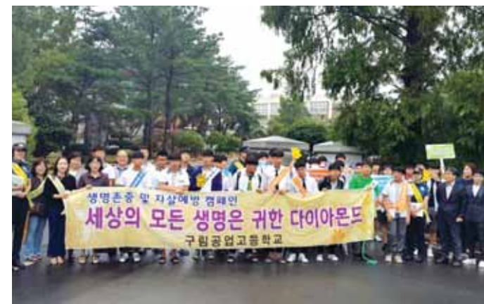
지난 6일 구림공업고등학교 정문에서 영암군청, 영암교육지원청, 구림공업고등학교 학생 및 교사 등 40여명이 참여한 가운데 학교폭력예방을 위한 합동 등교길 캠페인을 실시했다.