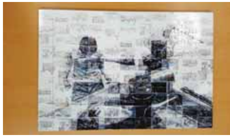
한남대생들이 직접 만든 5·18 교구.

“5·18 광주민주화운동 기록물이 세계기록유산에 등재됐지만 여전히 모르는 사람들이 많습니다. 더더욱 광주나 남도지역 외의 사람들은 5·18 자체에 대해서도 모르는 경우도 많구요. 교재와 교구를 직접 만들어 5·18 광주민주화운동을 알리기로 결심한 것은 그 때문이죠.”