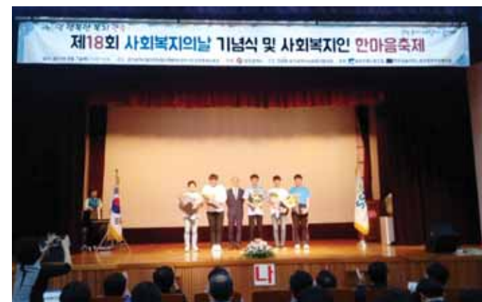
광주전남지방병무청(청장 장헌서)은 7일 ‘제18회 사회복지의 날’을 맞아 사회복지시설에서 성실히 복무중인 5명의 사회복무요원에게 표창장 및 부상을 수여했다.