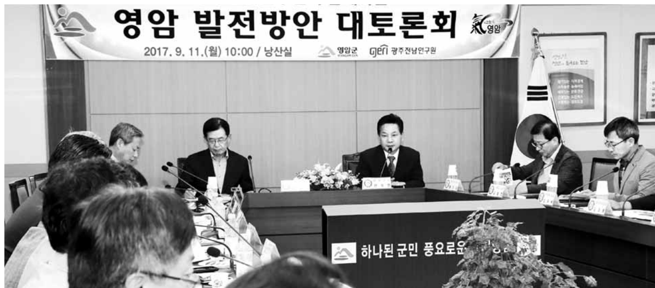
영암군은 11일 군청 남산실에서 ‘광주전남연구원과 함께하는 영암 발전방안 대토론회’를 열고 지역 경쟁력을 높일 현안의 효과적 추진 전략을 마련하기 위한 방안을 모색했다.

‘농업진흥구역 해제, 항공레저단지 조성하는데 시간을 절약할 수 있는 방안 없을까. 대불산단 조선산업 위기를 극복하는데 도움을 줄 정책은 뭐까.’ 영암군이 광주전남연구원과 지역 발전을 위해 머리를 맞댔다. 영암군은 11일 오전 군청 남산실에서 광주전남연구원과 ‘영암 발전방안 대토론회’를 개최했다. 이번 토론회는 지역 경제 활성화에 도움이 되는 정책을 발굴하고 주요 현안을 정부 정책 기조에 맞춰 풀어나갈 방안을 모색하는 자리라는 점에서 눈길을 끌었다. 이날 토론회에서도 영암지역 경쟁력 강화에 절실한 현안을 안건으로 상정, 광주전남연구원 연구원들과 함께 추진 전략과 개발 방향 등을 논의했다. 군이 꼽은 지역 현안은 ▲무화과 엑스포 개최 ▲주말N 영암 문화관광형 시장 조성 ▲항공레저단지 조성 ▲쌀 대체작목 ‘메밀’ 산업화 ▲특화음식 개발 ▲오색(五色) 스키야워이 조성 ▲정년상인 장업점포 조성 ▲대불산단 조선산업 위기 극복 방안 ▲에너지단지 조성 ▲천황사지구 개발 등 10개다. 군은 지난 1973년 무화과 첫 재배지로, 804개 농가(420ha)에서 연간 5408t을 재배, 연간 300억원의 소득을 올리는 등 전