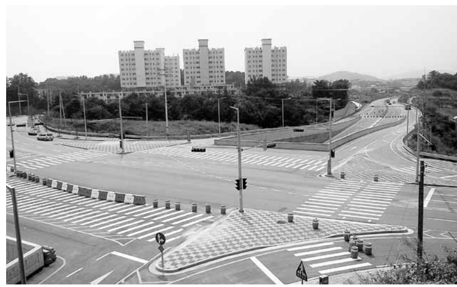
공사가 마무리돼 통행이 시작된 영광스포티움 교차로.

산업개발 사업’을 추진하고 있다. 그동안 청태전에 대한 이해 및 다도교육, 청태전 끓이기, 음용방법 등에 대한 교육이 실시됐으며 최근 장흥청태전연구회 주관으로 찻물색, 향기, 맛, 우린잎을 평가하는 품질평가도 진행됐다. 군은 특히 올해 장흥청태전 음용생활화 에 따른 학교 보급을 추진, 청태전의 명품화와 전통차문화 계승에 적극 나선다는 구상이다. /장흥=김용기기자·중부취재본부장