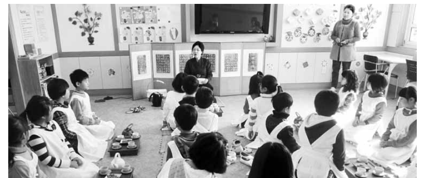
청태전 시음 등 체험 활동을 하고 있는 학생들.

제도에 대한 설명과 생산부터 수확 후 관리 및 유통까지 전 과정에서 필요한 실천 사항 등을 설명했다. 한편, 영암군은 무화과, 벼, 메론, 무 4개 품목 1902ha의 농경지를 주산지 GAP 안전성 분석사업 대상으로 선정, 안전성 검사를 진행중이다. 군 관계자는 “안전하고 위생적인 농산물을 공급할 수 있도록 적극 나설 것”이라고 말했다. /영암=전통기자 jbh@