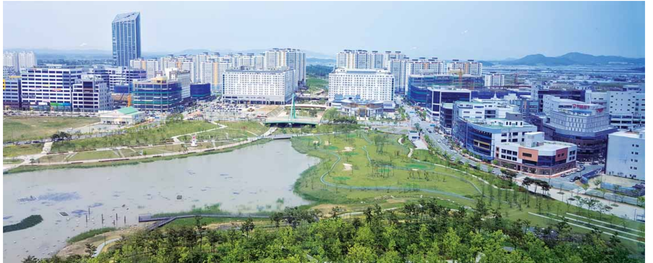
나주 빛가람혁신도시 전경. 나주시는 혁신도시 미래가치를 높이고 정주여건을 개선하기 위해 반드시 해결해야 할 과제로 악취문제를 꼽고 중·장기 대책 마련에 나선 상태다.

또 나주시가 호혜원에 대한 지난 2015년 12월 말 축산농가 폐업 보상을 마무리, 축산업 폐업이 이뤄졌음에도 지난해 혁신도시 주민들의 악취 민원은