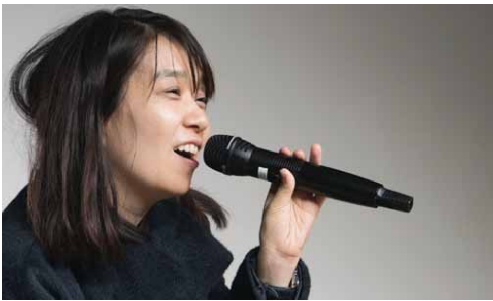
지난해 12월 5·18기념문화회관에서 열린 인문학 강연 당시 한강 작가.

최근 계엄군의 헬기사격 여부를 수사중인 검찰이 17명의 헬기조종사 신원을 확보하고 소환 조서에 들어가면서 어느 때보다 오월 진상 규