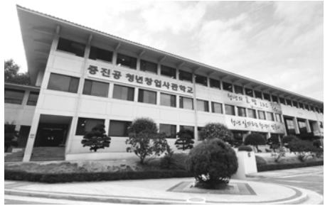
중진공 청년창업사관학교 전경.

중진공 청년창업사관학교 준비부터 안정화까지 전 과정 올해 500명 최대 1억원씩 지원 인사·노무 분야 코칭 프로그램