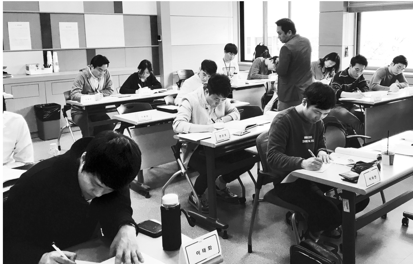
중소기업진흥공단은 도전의식과 참신한 아이디어로 무장한 '청년'들이 실패에 대한 두려움 없이 창업에 도전할 수 있도록 청년창업사관학교를 운영하고 있다. 청년사관학교 입교생들이 전문강사에게 창업실무 교육을 받고 있다.