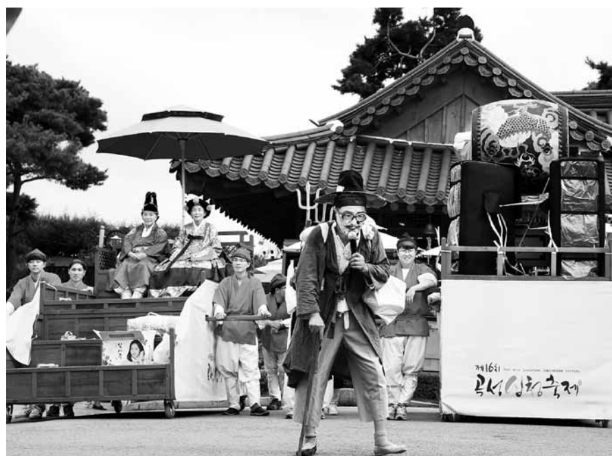
지난해 열린 곡성 심청축제 장면.