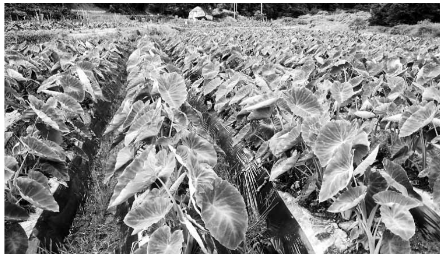
곡성토란(위 왼쪽)과 곡성기차마를 휴게소에서 판매되는 곡성 토란을 이용한 완자탕, 토란육개장 요리(오른쪽)와 곡성 토란 재배현장(아래).

‘흙 속의 달걀’로 불리는 토란을 활용한 즉석 가공식품과 요리가 만들어진다. 토란 주산지인 곡성의 인지도를 높이고 지역 민들 소득 향상으로 이어질 수 있도록 하겠다는 구상이 현실화될 지 주목된다.