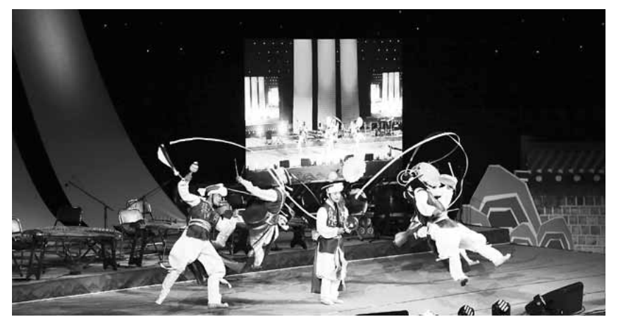
지난해 열린 구례동편소리축제 공연 모습.

축제 기간인 8일 호라산 일대에서는 ‘제7회 군수배 페라글라이딩 대회’가 열린다. /곡성=김계중기자 kjkim@