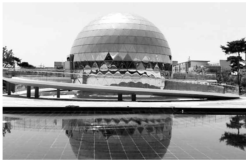
스페이스360의 외관 모습.