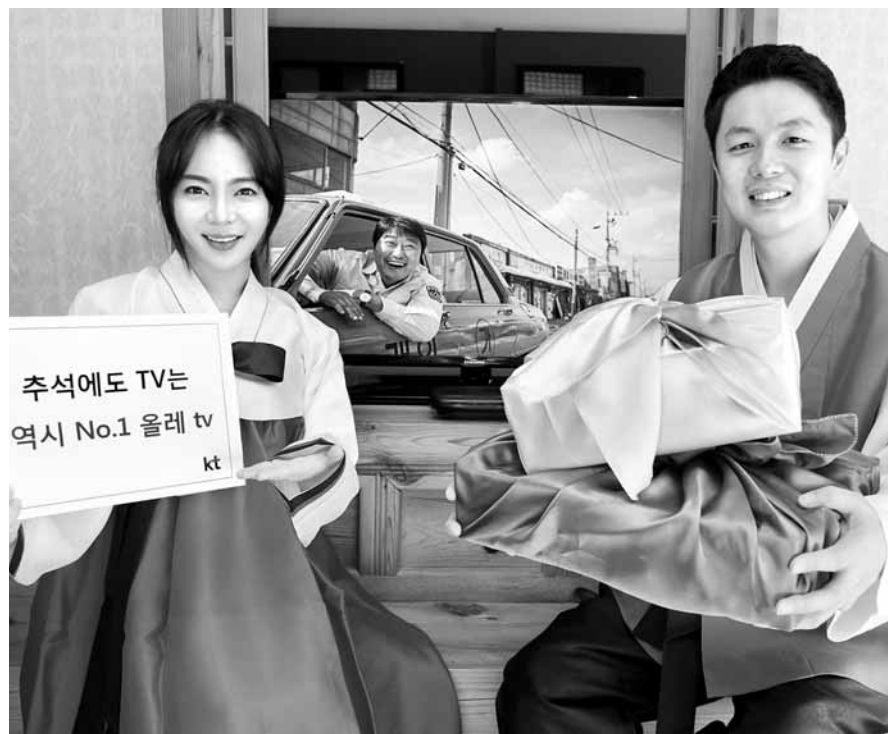
KT는 로밍서비스 뿐 아니라 자사 IPTV서비스인 올레 tv와 올레 tv 모바일에서도 VOD 할인 및 경품 이벤트를 실시한다. <KT 제공>

등 170여 개국에서 200kbps 이하 속도로 인터넷 검색, 특 위주의 데이터를 하루종일 이용할 수 있는 ‘데이터 로밍 하루종일 플러스’ 상품도 하루 7700원에서 5500원(부가세 포함)으로 2200원 인하된다.