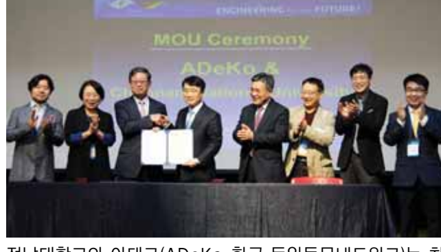
전남대학교와 아데코(ADeKo·한국 독일동문네트워크)는 최근 광주 서구 김대중컨벤션센터에서 과학기술 정책 분야 협력 등을 골자로 한 업무협약(MOU)을 했다.