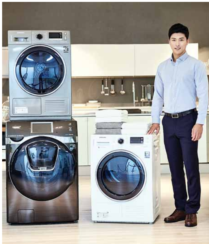
“전기료·건조시간 줄었어요” 삼성 건조기 출시

집합상가는 광주·전남 모두 투자수익률이 전분기보다 각각 0.22, 0.24%포인트 하락한 1.36, 1.18%를 기록했다. m 2 당 임대료는 광주는 24.3%, 전남은 17.0%로 전분기보다 각각 0.3, 0.2%포인트 상승했다. /김대성기자bigkim@kwangju.co.kr