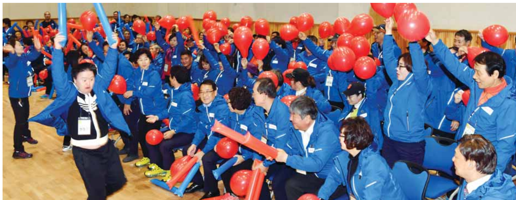
광주서 영호남 장애인 친선교류 제20회 영호남장애인 친선교류대회가 지난 31일 광주 북구 시화문화마을 커뮤니티센터에서 열렸다. 대회에 참가한 대구 달서구·광주 북구 장애인들과 관계자들이 즐거운 시간을 보내고 있다.

8.4%를 분담하고 있는데, 각 구가 관련 예산 지원에 동의하지 않으면 광주시 역시 지원하고 싶어도 할 수 없다는 것이다. 광주시가 자신들의 눈치를 살필 수 밖에 없는 자치구 평계를 대면서 예산지원 거부에 대한 비판적 여론을 자치구에 떠넘기고 있다는 비난의 목소리도 나오고 있다. 학부모와 시민사회단체들 사이에선 무상급식 예산지원 거부와 관련, 광주시가 경제논리와 정정보단 학생들을 위한 보편적 교육복지 실현 차원에서 접근해야 한다는 지적이 많다. 한편 시교육청이 발표한 내년도 고2·고3 무상급식 전체예산은 모두 443억원이다. 이는 올해 고3 학생 대상 무상급식 예산 314억원보다 129억원 증가한 금액이다. 이중 시 부담액은 올해 66억원보다 60억원 늘어난 126억원이다.