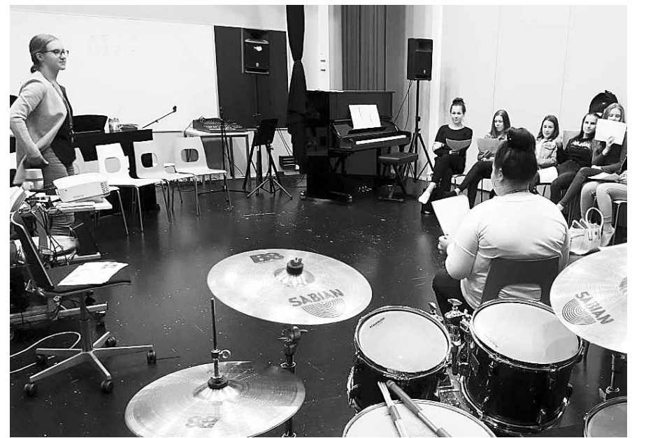
핀란드 라또카르타노 학교 음악실. 학생들이 음악 수업을 듣고 있다.

대학 같은 고교 '아르벤빠' 75개 과목 다양한 선택 가능 꿈 찾아주는 자율적 교육환경