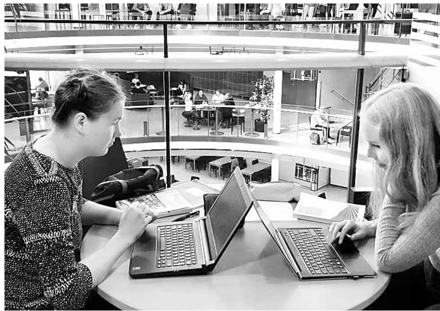
아르벤빠 학교 내부, 방사형 중앙 광장은 학생들의 식사와 휴식, 소통의 공간 역할을 한다.

무학년제 '라또카르타노' 맞춤형 성취도가 평가기준 한 교실 교사 2명 협력수업도