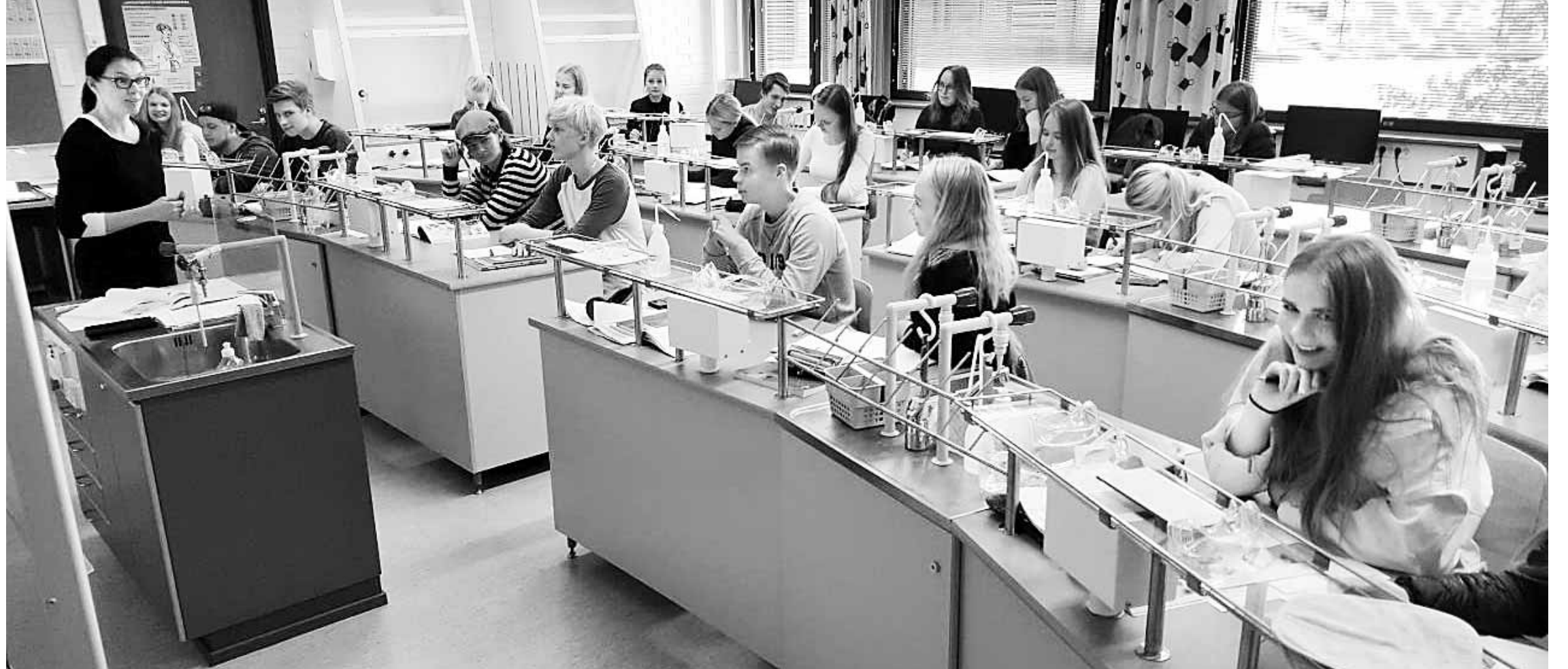
핀란드 아르벤빠 공립교 학생들이 실험 과목 수업을 듣고 있다. 이 학교 학생들은 자신들이 듣고 싶은 과목을 선택해 들을 수 있다.

이 학교의 경우 학년이 시작될 때 학생, 교사, 학부모가 함께 학생 수준에 맞는 1년의 목표를 정하고 목표에 얼마나 근접했는지를 따지는 평가 방식으로, 성적도 5학년까지는 매기지 않는다. 따라오지 못한다고