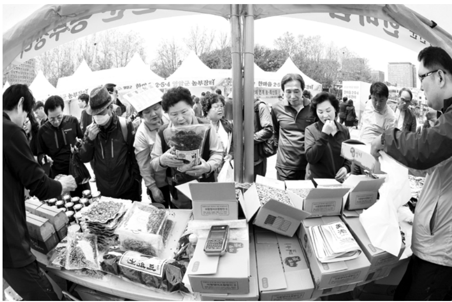
지난해 서울시장 앞 광장에서 열린 행사 장면.

영암·장흥·강진이 직거래 장터를 열고 지역 농·수 특산물을 홍보하며 도심 알리기에 나섰다. 16일 강진군 등에 따르면 3개 군은 17일 까지 서울서 동작구 노량진근린공원에서 ‘한마음 2·5·4 농부장터’를 연다. ‘2·5·4 농부장터’는 전남도 3개 군 장남(장흥 2일, 영암 5일, 강진 4일)로, ‘이(2)날 오(5)셔서 사(4)세요’라는 의미도 담고 있다. 매년 상·하반기 한 차례씩 3개 군이 돌아가며 공동 판매행사를 진행한다. 이번 행사는 강진군 주관으로 열린다. 3개 군은 이번 행사 기간, 22개의 판매대를 설치하고 지역 대표적 작물인 황토고구마, 대봉감 등 186개 품목을 도시민들에게 판매하면서 지역 브랜드를 홍보할 예정이다. 강진에서는 유기농 쌀을 비롯한 잡곡류, 건조연근 등 농산품과 전통된장, 떡 등