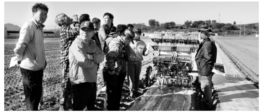
지난달 강진군 군동 시목마을에서 열린 양파 기계작업 시연회.

2900만t까지는 다소 여유가 있다”면서 “저수량이 관심단계인 3800만t까지 떨어지게 되면 생활용수 공급을 제한하는 등 조치를 검토할 것”이라고 말했다. 한편, 장흥댐은 조만간 2단계 광역상수도망 구축이 마무리되면 29만명 급수 인구를 64만명으로 늘릴 것으로 알려지고 있다. <장흥=김용기기자·중부취재본부장>