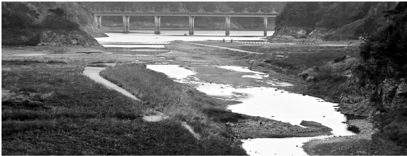
저수량이 바닥을 드러내고 있는 장흥댐 전경.

극심한 가뭄으로 장흥댐이 바닥을 드러내고 있다. 목포를 비롯, 장흥댐 물을 생활용수로 공급받는 9개 시·군의 물 문제를 우려하는 목소리가 나오고 있다. 16일 수자원공사 서남권관리단 등에 따르면 현재 장흥댐 저수량은 전체 저수용량 1억9500만t의 26%(5200만t)에 불과해 하천유지수 2만3000t을 방류하는데 그치고 있다. 평상시 하루 방류용량 29만t의 절반에도 미치지 못하는 형편이다. 당장, 수자원공사가 운영하는 소수력발전도 가동을 중단한 상태다. 하루 2만2000t씩 방류해 가뭄하던 소수력발전도 가뭄