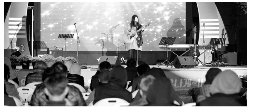
‘17일간의 음악여행’ 기간 중 열린 ‘장필순·조동희와 함께 하는 포크여행’ 지역 주민과 관광객 등 230여명이 음악을 들으며 가을밤을 즐기고 있다.

장흥 대덕읍 아이들에게 방과후 놀공간이 생긴다. 장흥군은 최근 국제아동권리기관인 세이브더칠드런 호남지부와 협약을 맺고 농어촌아동지원사업 등을 공동으로 진행하기로 했다. 세이브더칠드런은 아동권리 실현을 위해 설립된 국제기구개발 비정부기구로, 다문화인식개선, 아동권리교육, 농어촌아동지원사업 등을 펼치고 있다. 장흥군은 이번 협약을 통해 농어촌 아이 돌봄체계 강화에 도움이 되는 전용공간 구축 및 아이들의 충분한 놀 권리 보장을 위해 힘쓰기로 했다. 특히 협약에 따라 대덕읍에는 농어촌 어린이 놀이터가 생겨 방과 후 기관이 없어 불편함을 겪었던 지역 아이들에게 도움이 될 전망이다. 장흥군이 부지를 제공하고 세이브더칠드런은 아이들을 위한 놀이터를 신축한다. 세이브더칠드런 호남지부 관계자는 “아동보호와 권리증진을 위한 다양한 활동을 지속적으로 펼쳐나갈 것”이라고 말했다. <장흥=김용기기자·중부취재본부장>