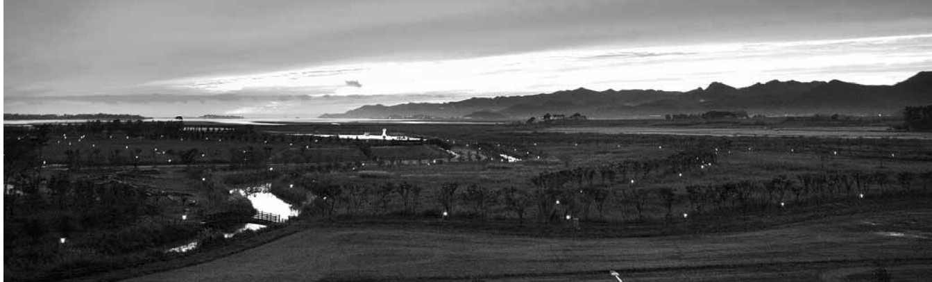
줄포만 갯벌생태공원 일대에서 바라본 일몰.