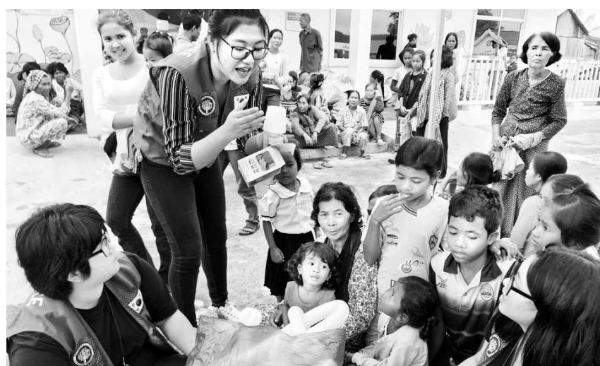
광주지역 고교생들이 캄보디아광주진료소에서 현지 어린이들을 대상으로 문화프로그램을 진행하고 있다.

었다. 뒤늦게 이를 파악한 그는 당황한 듯한 몸짓을 하며 MDL 북쪽으로 돌아갔다. 영상 속 건물 한가운데로 MDL이 지난다는 점을 고려하면 북한군은 MDL을 살짝 넘은 정도가 아니라 수m 남쪽으로 내려온 것으로 추정된다. 그가 MDL 남쪽에 머무른 시간이 5초 정도는 됐다. 유엔사는 “북한군이 MDL 너머로 총격을 가했다는 것과 북한군 병사가 잠시나마 MDL을 넘었다는 것을 확인했고 이는 두 차례의 유엔 정전협정 위반이라는 중요한 결론을 내렸다”고 밝혔다. 조사 결과를 발표한 채드 캐럴 유엔사 공보실장은 “유엔사는 공동경비구역 내에서 발생한 불확실하고 모호한 사건을 갈등을 고조시키지 않고 마무리한 JSA 경비대대 소속 한국군 대대장의 전략적인 판단을 지지한다”고 강조했다.