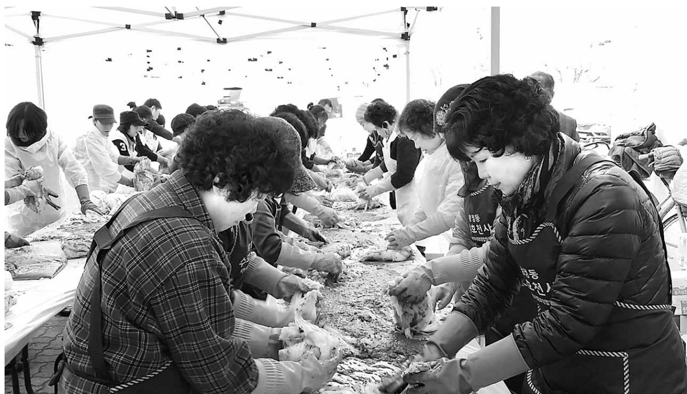
“희망의 김장김치” 정성들여 담귀요” 남원시 왕정동행정복지센터는 지난 22일 복지센터 앞마당에서 ㈜이마트 남원점, 수호천사봉사회, 새마을부녀회 소속 50여명과 함께 ‘희망의 김장김치’를 담귀 경로당·복지시설 30곳과 복지취약계층 64가구에 전달했다.

원, 셋째는 1000만원, 넷째 이상은 1500만원을 준다. 이외 출산 가정에 산모·신생아 건강관리사 이용료, 출산축하 기념품, 돌맞이 사진 촬영권을 지원하는 한편, 공공장소에 수유방을 설치하는 등 아이낳기 좋은 분위기를 만드는 데도 공을 들인 결과라는 것이다. 황숙주 군수는 "지역의 지속적 성장을 위해서는 젊은층이 돌아오고 아이를 많이 낳아 활기찬 지역이 되어야 한다"면서 "젊은층이 원하는 정책을 발굴·추진해 사람이 넘치는 활기찬 지역을 만들 것"이라고 말했다. /순창=장영근기자 jyg@kwangju.co.kr