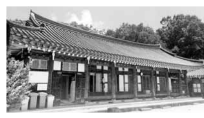
곡성 성류사 안심당