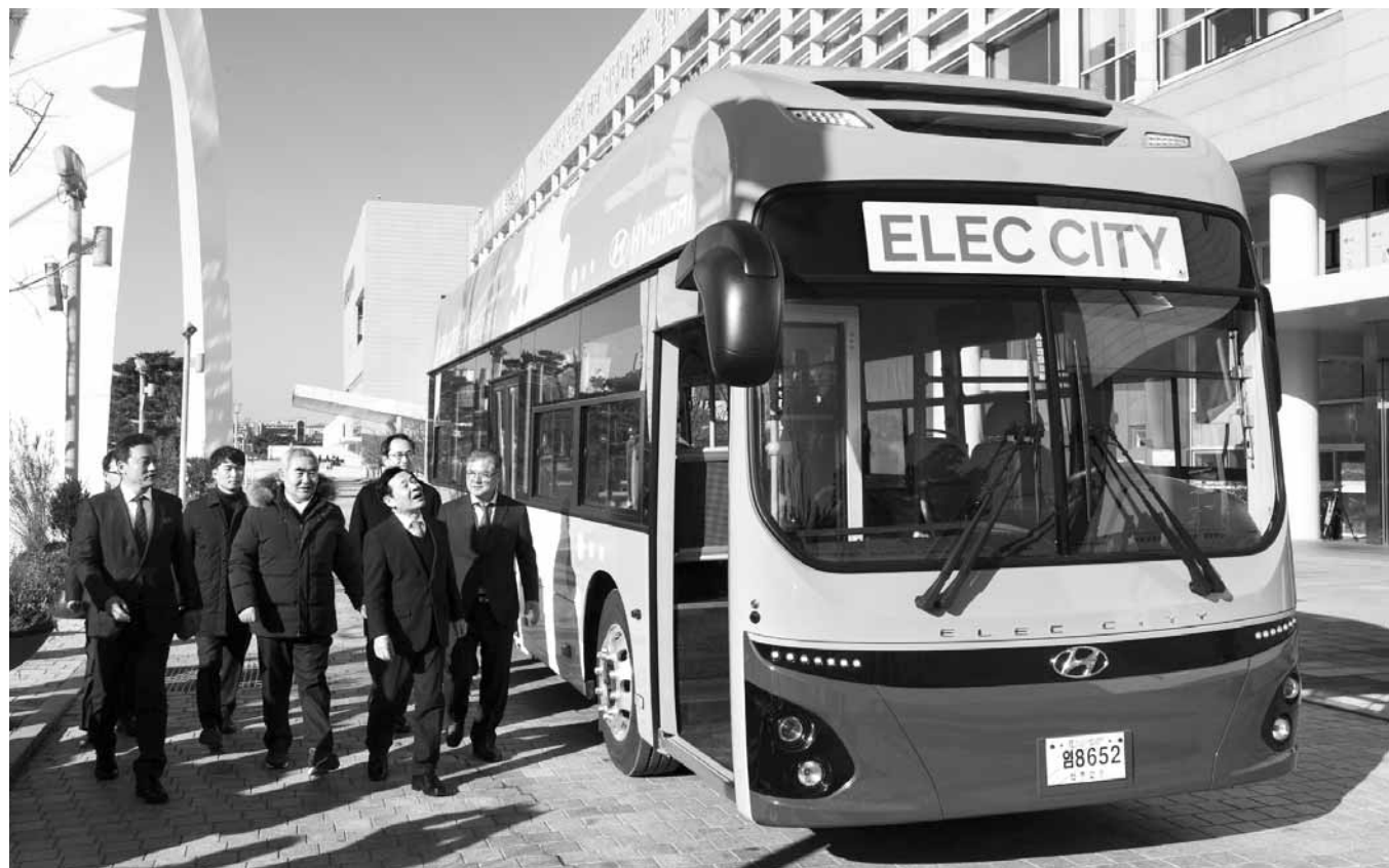
5일 오전 광주시 청사 행정동 입구에서 윤정현 광주시장 등이 전기 저장 시내버스 '일렉시티'에 오르고 있다.

전기버스는 한번 충전하면 300km 이상 운행할 수 있어 연료비 절감은 물론 친환경 도시 이미지 구축에도 큰 도움이 될 것으로 기대된다. 전기 버스는 50% 이상의 연료비