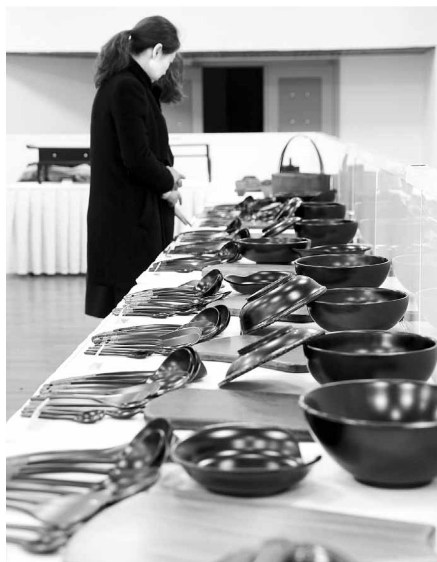
"옷칠 목공예 매력에 빠져요" '남원시 옷칠·갈기교육' 수강생과 옷칠 목공예 동호회의 작품 전시·판매가 19일부터 이틀간 남원시청 로비에서 열린다. 제품 판매 수익은 불우이웃돕기 성금으로 쓰인다. 전시·판매코너를 찾은 지역민들이 작품을 살펴보고 있다.

3044억원을 지방교부세로 확보했다. 부문별로는 농림분야 1533억원(23.7%), 사회복지 분야 1458억원(22.5%), 환경보호분야 765억원(11.8%), 국토 및 지역개발 분야 478억원(7.4%), 문화 및 관광분야 442억원(6.8%) 등에 투입될 예정이다. 주요 사업으로는 사대 일반산업단지 조성 80억원, 교룡대로 개설 30억원, 신정대로 개설 30억원이 반영됐고 대통령 정책과제에 포함된 가야사 연구·복원과 남원을 성 복원사업 25억원, 가야문화유산 발굴 조사에도 12억원이 투입된다. /남원=백선기자 bs8787@kwangju.co.kr