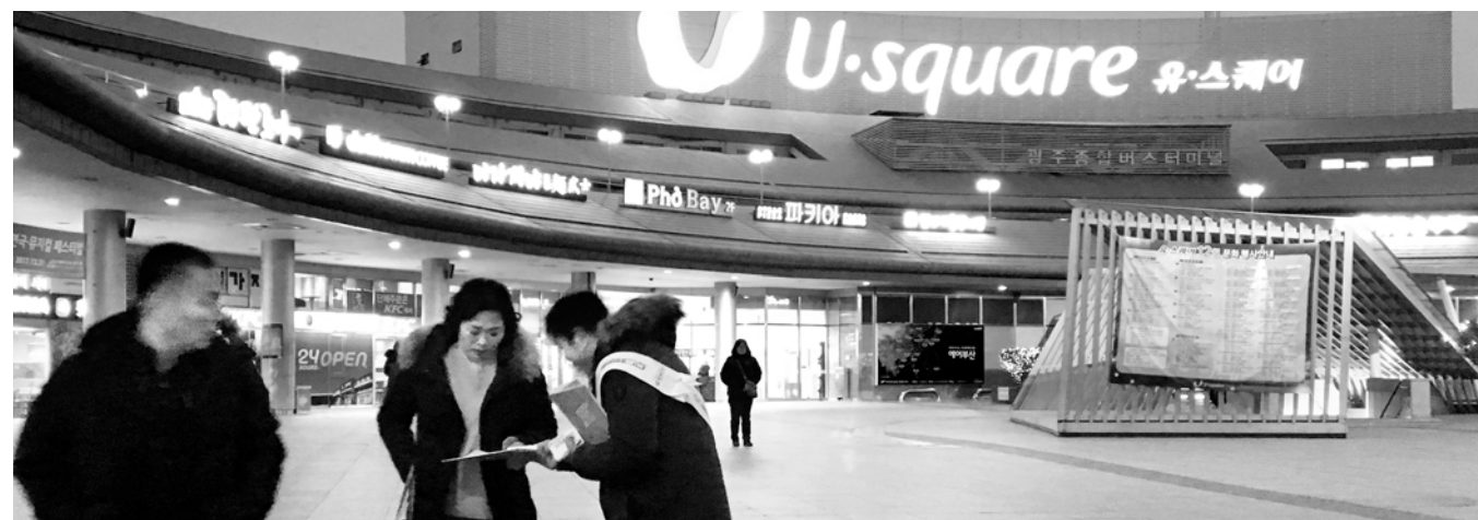
광주환경공단 직원들이 최근 광주 유스퀘어 터미널 앞에서 평창 동계 올림픽 홍보물을 배부하는 모습.

광주시 소방안전본부부는 24일 "소방청이 전국 18개 시·도를 대상으로 한 '2017년 하트세이버 운영' 평가에서 처음으로 최우수기관에 선정됐다"고 밝혔다. 하트세이버 평가는 심정지 환자 소생률과 하이세이버 배치 수여도 등 하트세이버 운영 현황 전반에 대해 실시한다. 시는 심정지 환자 소생률이 15.8%로 전국 평균 9.9%보다 월등히 높았다.