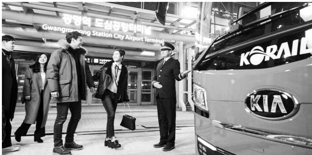
광명역 도심공항터미널에서 출국수속을 마친 여행객들이 인천공항까지 운행하는 KTX 광명리무진버스를 타고 있는 모습. 도심공항터미널을 이용할 경우 호남선은 약 30분~45분이 줄고 출국소요 시간도 최소 20분 이상 단축할 수 있다.