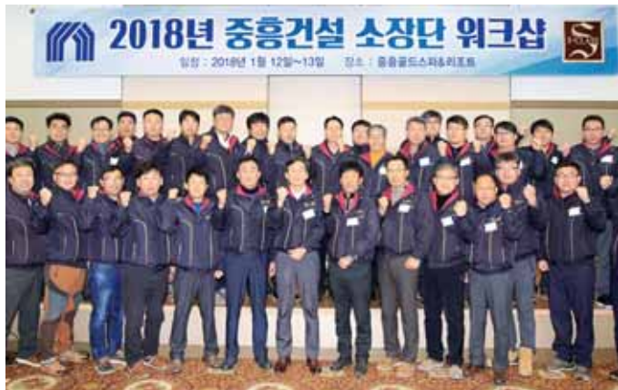
중흥건설은 지난 12일 나주 중흥리조트에서 중흥건설 전국 현장 소장들에게 대한 직무교육을 했다. 이번 교육은 하자발생제로운공과 안전교육, 외부강사 초청강연으로 진행했다.