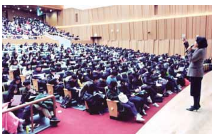
전남대학교에서는 최근 자연대 3호관에서 2019학년도 대입 전형형을 치르는 예비고3 수험생과 학부모 등 800명을 대상으로 모의전형 체험캠프를 열었다.