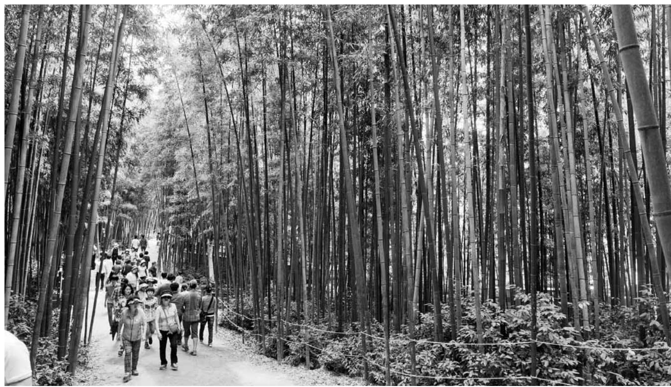
담양군은 대나무밭을 세계중요농업유산으로 등재하기 위한 학술용역을 실시키로 하는 등 본격 행보에 나섰다.

앞서, '담양 대나무밭'은 지난 2014년 국가중요농업유산 제 4호로 지정된 상태로, 대나무가 각종 농자재와 지역민의 생활용품으로 다양하게 활용돼 왔을 뿐만 아니라